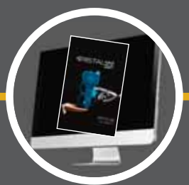
Software Kristal 3D