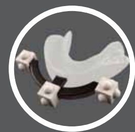
Universal Stent con radiologia