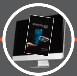
Software Kristal 3D